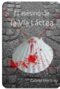
El asesino de la Vía Láctea.