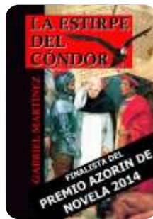
La estirpe del Cóndor, finalista del premio Azorín de novela, 2014