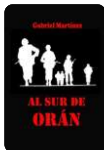
Al sur de Orán